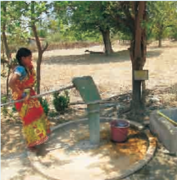
ନଳକୂପ ପରିଚ୍ଛନ୍ନତା ଉପରେ ଦିଆଯାଇଛି ଗୁରୁତ୍ୱ

ଗାଁର ଜଳ ଓ ପରିମଳ ଅଭ୍ୟାସକୁ ମନେପକାଇ ହଟେଶ୍ୱର କହନ୍ତି ୧୭୭୫ ଲୋକଫାଖ୍ୟା ବିଶିଷ୍ଟ ଏହି ଗାଁରେ ରହିଛି ଦୁଇଟି ପଡ଼ା । ଗୋଟିଏ ଖଇରାନୀ ଅନ୍ୟଟି କୋମାଖାନ୍ ପଡ଼ା । ଉଭୟ ପଡ଼ାରେ ରହିଛି ୧୨ଟି ନଳକୂପ । ୫ଟି ନଳକୂପ ଭାଙ୍ଗିଯାଇଛି । ୭ଟି ଚାଲିଛି । ଖରାଦିନ ନଆସୁଣୁ ଲୋକେ ଭୋଗଟି