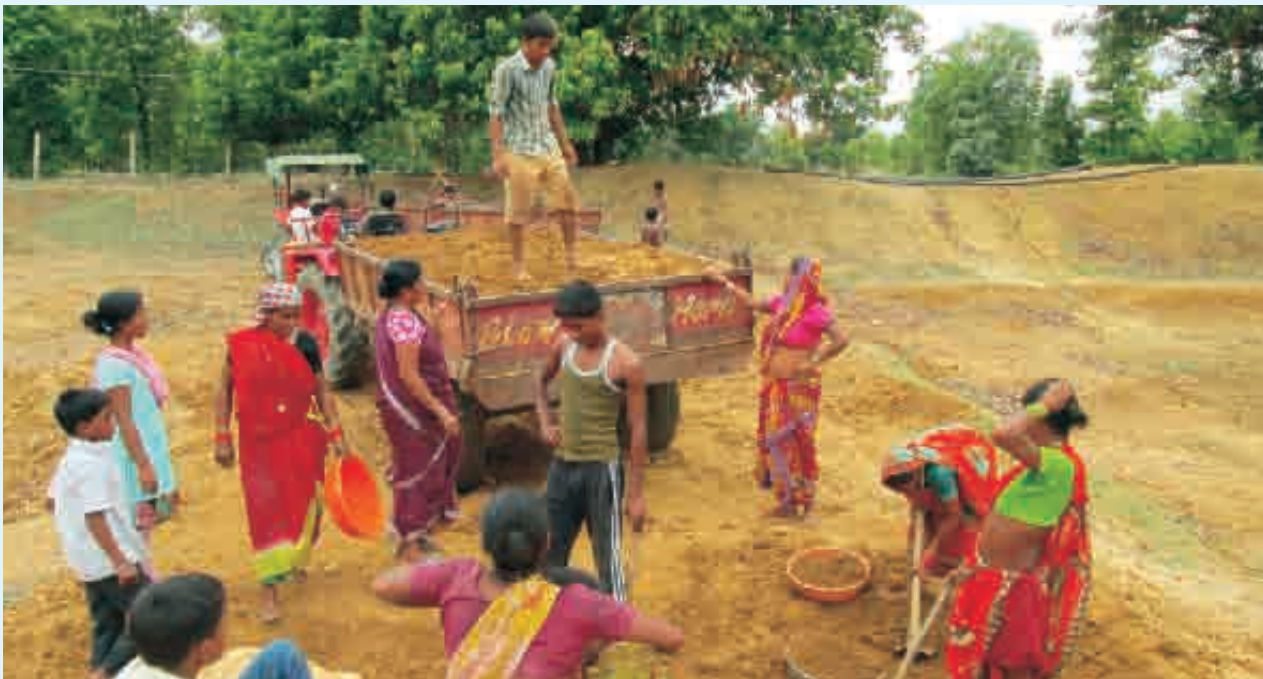
ନର୍ଦ୍ଦମା ଯୋଡିବା ପାଇଁ ଗ୍ରାହକରୁ ମାଟି ଉଠାଇଛନ୍ତି ମହିଳା ଦଳ

ଏହିଭଳି ବିକଟ ପରିସ୍ଥିତିକୁ ସୁଧାରିବା ପାଇଁ ଗାଁଲୋକଙ୍କର ବି ଯେ ଭୂମିକା ଥାଇପାରେ ତାହା କେହି ଅନୁଭବ କରୁ ନଥିଲେ । ଆର୍ସିଡିସି ତାହାର ପ୍ରକଳ୍ପ କାର୍ଯ୍ୟକାରୀ କରୁଥିବା ଗାଁ ମଧ୍ୟରେ ଗୁଡ଼ାପଡ଼ରା ମଧ୍ୟ ଗୋଟିଏ । ପ୍ରଥମେ ଯେତେବେଳେ ଜଳ ପରିମଳ ବିଷୟରେ ଗାଁରେ ଆଲୋଚନା ହେବା ଆରମ୍ଭ ହେଲା ଜଣେ ଦି ଜଣ ଛାଡ଼ି କେହି ବି ଆଗ୍ରହୀ ନ ଥିଲେ । କ୍ରମଶଃ ମହିଳାମାନଙ୍କ ସହିତ ଅନ୍ୟ କିଛି ବ୍ୟକ୍ତି ବି ଆଲୋଚନାମାନଙ୍କରେ ଯୋଗଦେବା ଆରମ୍ଭ