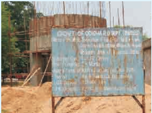
୩ ବର୍ଷ ଧରି ଚାଲିଛି କାମ

ଏହି ଭଳି ସରକାରୀ ଯୋଜନାମାନଙ୍କରେ ବିଶେଷକରି ଯେଉଁଥିରେ ଲୋକଙ୍କର ଜରୁରୀ ଆବଶ୍ୟକତା ଜଡ଼ିତ ରହିଛି, ସେଥିରେ ଲୋକେ ଓ ପଞ୍ଚାୟତ ସାମିଲ ନ ରହିଲେ କିମ୍ବା ବିଭିନ୍ନ ବର୍ଗ ଓ ଅଂଶୀଦାରଙ୍କ ଭିତରେ ତାଳମେଳ ନ ରହିଲେ ସରକାର ଭୁଲ ଯୋଜନା କରିପାରନ୍ତି ଏବଂ ଭଲ ଯୋଜନା କଲେ ମଧ୍ୟ ତାହା ଭେଲ ହେବାର ଆଶଙ୍କା ଯଥେଷ୍ଟ ରହିଛି । ଖ୍ରୀଷ୍ଟବଦ୍ ସହାୟତାରେ ଆରସିଡିସି ପକ୍ଷରୁ ଆରମ୍ଭ କରାଯାଇଥିବା ପ୍ରକଳ୍ପ ଏହି ଦିଗଟି ପ୍ରତି ଜାଗ୍ରତ । ଏହି ସବୁରେ ଲୋକଙ୍କ ଓ ପଞ୍ଚାୟତମାନଙ୍କ ଭାଗିଦାରୀ ବଢ଼ାଇବା ପାଇଁ ପ୍ରକଳ୍ପଟି ଉଦ୍ୟମ କରୁଛି । ଆରସିଡିସି ପକ୍ଷରୁ ନୂଆପଡ଼ା ଜିଲ୍ଲାର ପାଞ୍ଚଟି ପଞ୍ଚାୟତରେ ଜଳର ଗୁଣାତ୍ମକମାନ ଉପରେ ନିର୍ଦ୍ଦିଷ୍ଟ କେତେକ କାର୍ଯ୍ୟକ୍ରମ ହାତକୁ ନିଆଯାଇଥିବା ଜାଣିବା ପରେ ଗ୍ରାମବାସୀମାନେ ସହଯୋଗ ପାଇଁ ଆଗେଇ ଆସିଥିଲେ । ଗ୍ରାମ୍ୟ ଜଳ ଓ ପରିମଳ କମିଟି ଗଢ଼ାଯାଇଛି । ଜଳ ଓ ପରିମଳ କମିଟିର ପ୍ରତିନିଧିମାନଙ୍କୁ ନେଇ ପଞ୍ଚାୟତ ସ୍ତରୀୟ ଜଳବନ୍ଧୁ ମଞ୍ଚ ଓ ବ୍ଲକ୍ ସ୍ତରୀୟ ମଞ୍ଚ ଗଠନ କରାଯିବା ପରେ ଗ୍ରାମ୍ୟ ଜଳ ଯୋଗାଣ ଓ ପରିମଳ ବିଭାଗର ଫ୍ଲୋରାଇଡ୍ ନିରାକରଣ ପଦକ୍ଷେପକୁ ସମର୍ଥନ କରିବା ପାଇଁ ଗାଁ ସ୍ତରରେ ଆରମ୍ଭ ହୋଇଥିଲା ପ୍ରସ୍ତୁତି । ସଂଗଠିତ ଭାବେ ଜଳର ଗୁଣାତ୍ମକ ମାନକୁ ନେଇ ଚର୍ଚ୍ଚା କରିବାର ପ୍ରକ୍ରିୟା ଜିଲ୍ଲା ପ୍ରଶାସନକୁ କ୍ରିୟାଶୀଳ କରାଇଥିଲା ।