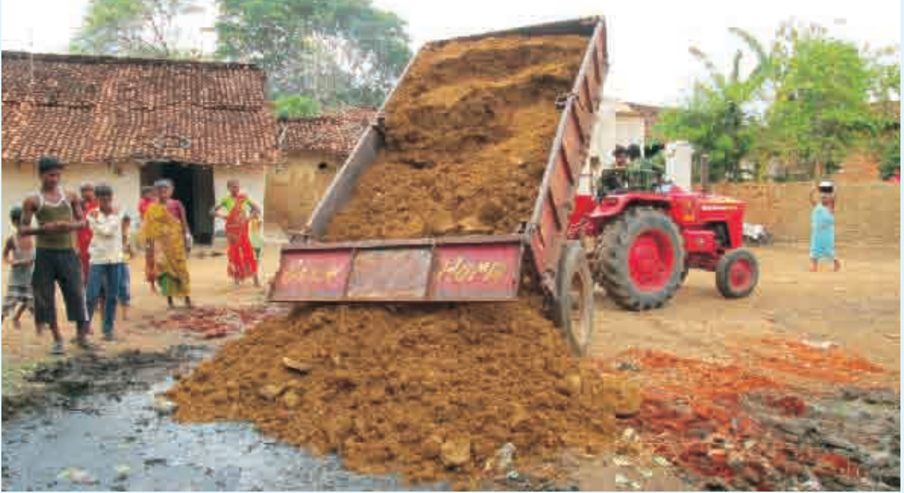
ଶେଷରେ ପ୍ରମାଣ ସାକାର ହେଲା : ନର୍ଦ୍ଦମାକୁ ସମତୁଲ କରିବା ପାଇଁ ମାଟି ପକାଯାଉଛି

କଲେ । ଆଲୋଚନାମାନଙ୍କରେ ଗାଁର ଜଳ ପରିମଳ ସ୍ଥିତି ଚର୍ଚ୍ଚା ହେବା ଆରମ୍ଭ ହେଲା । ଏମିତି ଏକ ଆଲୋଚନାରେ ଅବ୍ୟବହୃତ ହୋଇ ପଡ଼ିଥିବା ସେହି କୂଅର ଚର୍ଚ୍ଚା ପଡ଼ିଲା । କୂଅ ନିକଟର ନର୍ଦ୍ଦମା କଥା ମଧ୍ୟ ଗାଁ ଲୋକେ ଆଲୋଚନା କଲେ । ପ୍ରତିକାର କରିବା ପାଇଁ ପଞ୍ଚାୟତ ଓ ସରକାରୀ ବିଭାଗକୁ ଚିଠି ଲେଖିଲେ । କିନ୍ତୁ ପରିସ୍ଥିତିରେ କିଛି ପରିବର୍ତ୍ତନ ହେଲା ନାହିଁ ।