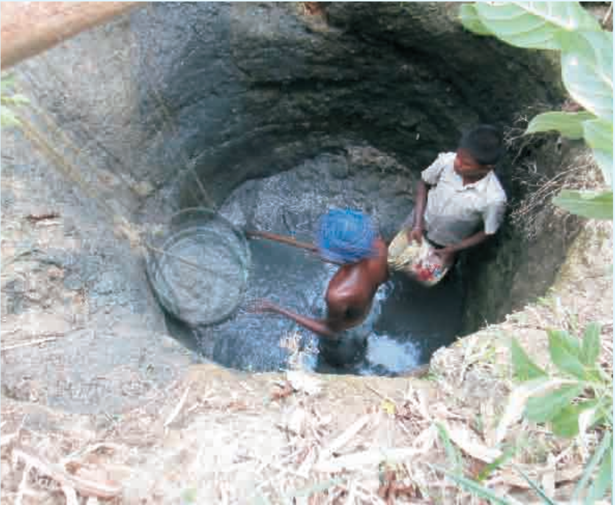
ଚାଲିଛି କୂଅ ଖୋଳା