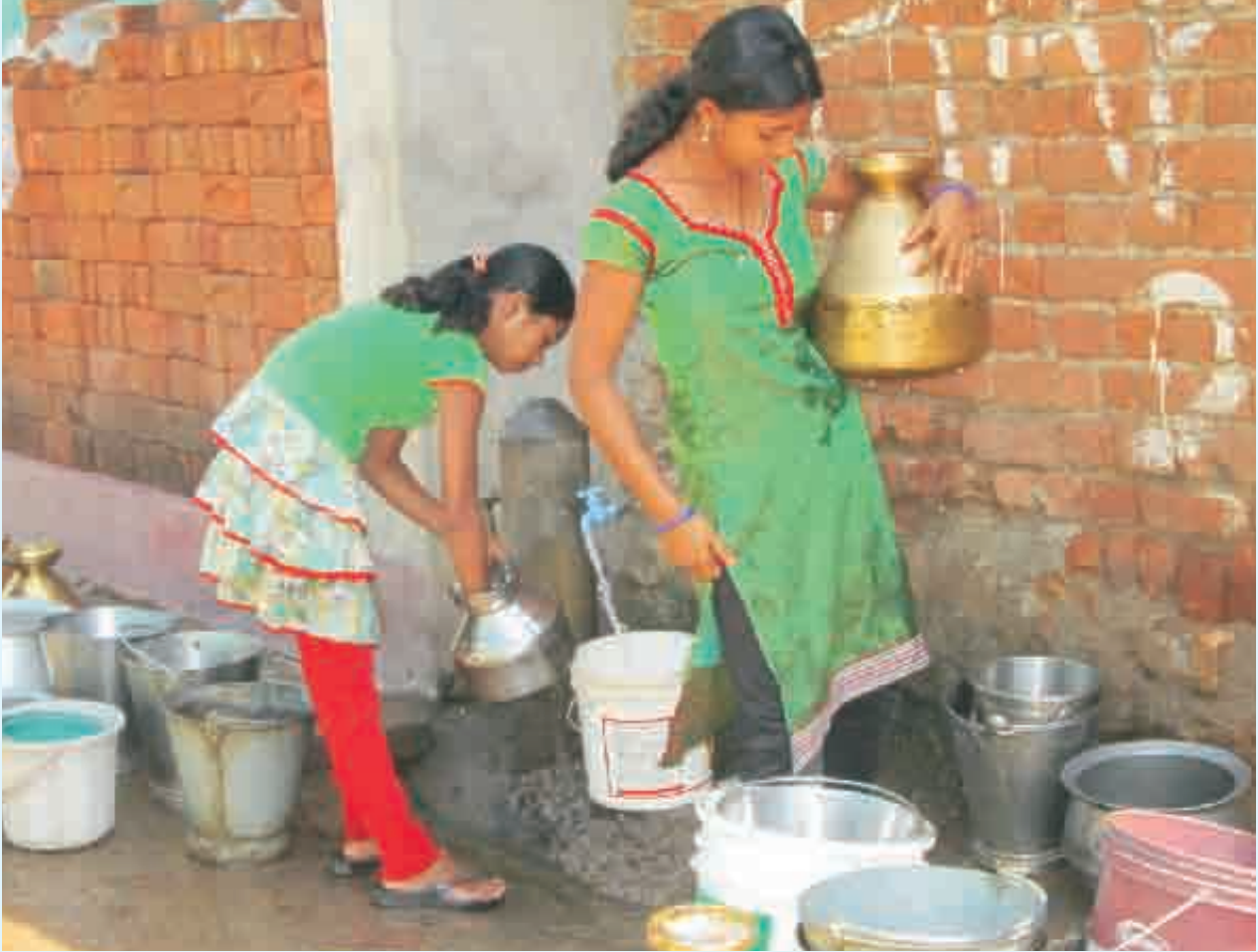
ପାଣି ପାଇଁ ଅପେକ୍ଷାରତ ରେଙ୍ଗା ଗ୍ରାମର ମହିଳା

କରାଗଲା । ନିଜ ଘରକୁ ପାଇବୁ ଫ୍ରେଣ୍ଡସ୍ ନେଇଥିବା ୨୬ଟି ପରିବାର ଠାରୁ ପ୍ରତି ମାସରେ ୫୦ ଟଙ୍କା ଲେଖାଏଁ ଏବଂ ଷ୍ଟାଣ୍ଡପୋଷ୍ଟରୁ ପାଣି ନେଉଥିବା ବଳକା ୧୫୪ ପରିବାର ମାସକୁ ୧୦ ଟଙ୍କା ହିସାବରେ ଚାନ୍ଦା ଦେବା ନିୟମିତ ଅଭ୍ୟାସରେ ପରିଣତ ହୋଇଗଲା ।