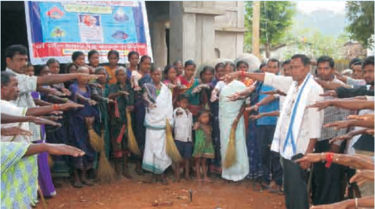
ଦିନେ ନୁହେଁ କି ଓଦିଏ ନୁହେଁ, ସର୍ବଦା ଗାଁକୁ ସ୍ଵଚ୍ଛ ପାଇଁ ଶପଥ ନେଉଛନ୍ତି ଗ୍ରାମବାସୀ

୨୦୧୪ରେ ସାମୁହିକ ଶ୍ରମଦାନ କରିଆରେ ଗାଁ ପରିବେଶ ନିର୍ମଳ କରିଥିବା ବେଳେ ଭାଲେଶ୍ୱର ପଞ୍ଚାୟତର ଭାଲେଶ୍ୱର, ଆମୋଦି, କୁରୁମୁଣ୍ଡା ଟାମକିଦାଦର, ବାରକୋଠି, କଦାତାପ ଆଦି ଗ୍ରାମର ଚତୁଃପାର୍ଶ୍ୱ, ଜଳଭସ୍ମ ଓ ବାରକୋଠି ବିଦ୍ୟାଳୟ ପରିସରରେ ସଫେଇ କରାଯାଇଥିଲା । ସାଇପଲା ପଞ୍ଚାୟତର ସାଇପଲା, ସାଲେପଡ଼ା, ଖଇରାନୀ ପିପଲଛଣ୍ଡି, ତୁଙ୍ଗୁରିପଡ଼ା ଗ୍ରାମ ସଫେଇରେ ପୁରୁଷମାନଙ୍କ ଠାରୁ ଦ୍ୱିଗୁଣା ସଂଖ୍ୟକ ମହିଳା ଭାଗ ନେଇଥିଲେ । ମୋଟ ୬୯ଜଣ ପୁରୁଷ ଗାଁ ସଫେଇରେ ଭାଗ ନେଇଥିବା ବେଳେ ୧୬୪ମହିଳାଙ୍କ ଅଂଶଗ୍ରହଣ ଦେଖିବାକୁ ମିଳିଥିଲା । ବେଲଟୁକୁରୀ ପଞ୍ଚାୟତର ସିଅପୁର, କାଦୋମେରୀ, ଦେଓଗାଁ, ଗୁଡ଼ପଦର, ବଖରମାଲ ସମେତ କୁରେଶ୍ୱର ପଞ୍ଚାୟତର କୁରେଶ୍ୱର, ଉଦ୍ୟାନବନ୍ଧ, ଚହକୋପଡ଼ା, ଦୋହଲପଡ଼ା ଆଦି ଗ୍ରାମ ଓ ରେଙ୍ଗ ତଥା ଖଇରବାଡ଼ିର ବିଦ୍ୟାଳୟ ପରିସରକୁ ସଫା କରିଥିଲେ ଗ୍ରାମବାସୀ ।