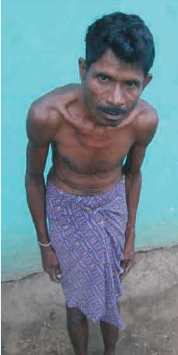
ପ୍ରତ୍ୟକ୍ଷିତ ଜଳର ସରଣା ଭୋଗୁଛନ୍ତି ନୂଆପଡ଼ାବାସୀ