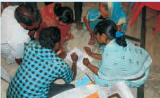
ଚାଲିଛି ଜଳ ନିରାପତ୍ତା ଯୋଜନାର ପ୍ରସ୍ତୁତି କାର୍ଯ୍ୟକ୍ରମ

ନିପଟ ମଫସଲର ଏହି ଆଦିବାସୀ, ହରିଜନ ବହୁଳ ଗାଁମାନଙ୍କର ଲୋକେ ଏଇଥିପାଇଁ ଅନୁସରଣ କରୁଛନ୍ତି ସମୟରେଖା, ଐତିହାସିକ ଗତି ଚିତ୍ର, ସମୟ ଧାରା, ରତ୍ନକାଳୀନ ମାନଚିତ୍ର, ରୁଟି ଚିତ୍ର, ସମ୍ପଦମାନଚିତ୍ର ଭଳି ସରଳ ପଦ୍ଧତି ।