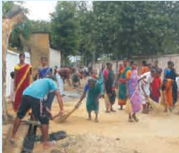
ସ୍ବଳ୍ ରହିବାର ପଣ - ଚାଲିଛି ସାମୁହିକ ସଫେଇ କାର୍ଯ୍ୟ

୧୧ ଅକ୍ଟୋବର ୨୦୧୪, ରେଙ୍ଗ ବିଦ୍ୟାଳୟ ପାଇଁ ସେଦିନ ଥିଲା ନିଆରା ଘଟଣା । ପ୍ରାର୍ଥନା ପରେ ସବୁଦିନ ପରି ଛାତ୍ରଛାତ୍ରୀମାନେ ଶ୍ରେଣୀ କକ୍ଷକୁ ଫେରିନଥିଲେ । ସ୍ବାଧୀନତା ଦିବସ ଓ ଗଣତନ୍ତ୍ର ଦିବସ ପାଳନ ପରି ସେଦିନିର ପରିବେଶ ଥିଲା । ବିଭିନ୍ନ ଶ୍ରେଣୀର ୧୧୮ଜଣ ଛାତ୍ରଛାତ୍ରୀଙ୍କ ଗହଣରେ ଉପସ୍ଥିତ ଥିଲେ ୫ଜଣ ଶିକ୍ଷକ, ୩ଜଣ ଶିକ୍ଷୟିତ୍ରୀ, ୫ ଜଣ ବିଦ୍ୟାଳୟ ପରିଚାଳନା କମିଟିର ସଦସ୍ୟ ଓ ଦୁଇଜଣ ଆରସିଡିସିର କର୍ମୀ । ମୋଟ ୧୨୩ ଜଣଙ୍କ ଉପସ୍ଥିତିରେ ସ୍ବଳ୍ ଭାରତ ଅଭିଯାନ ବିଷୟରେ ଆଲୋଚନା କରାଗଲା । ସଫା ସୁଚ୍ଚରା ରହିଲେ ରୋଗ ହେବନି ବୋଲି ଅତିଥିମାନେ ପିଲାଙ୍କୁ ବୁଝାଇଥିଲେ । ବ୍ୟକ୍ତିଗତ ପରିଚ୍ଛନ୍ନତା, ଗାଁ ପରିମଳ, ହାତଧୁଆ