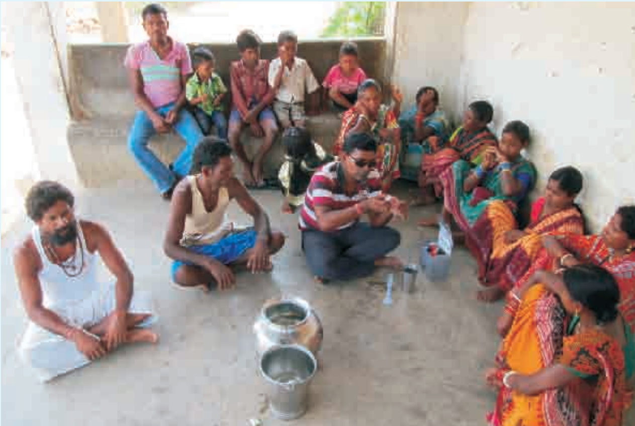
ଗ୍ରାମର ବିଭିନ୍ନ ଜଳଭଣ୍ଡର ପରୀକ୍ଷଣରେ ନିମଗ୍ନ ଆରସିଡିସିର କର୍ମଚାରୀ

ଲୋକେ କରିଥିବା ଜଳ ପରୀକ୍ଷଣ ଦୁଇଟି ଉଦ୍ଦେଶ୍ୟ ସାଧିତ କରିପାରିଛି । ପ୍ରଥମରେ, ଲୋକେ ଅଧିକ ଭାବରେ ଫ୍ଲୋରାଇଡ୍ ଓ ଫ୍ଲୋରୋସିସ୍ ସଚେତନ ହେବା ସହିତ ନିଜର ପାନୀୟ ଜଳ ଉତ୍ସର ମାନ ଜାଣି ପାରିଛନ୍ତି । ଦ୍ୱିତୀୟରେ, ଲୋକେ ଆରସିଡିସି ଦ୍ୱାରା କାର୍ଯ୍ୟକାରୀ ହେଉଥିବା ପକ୍ଷରେ ଆଗ୍ରହର ସହିତ ସାମିଲ ହେବାର ଏକ ଦୁର୍ବାର ଆକର୍ଷଣ ପାଇପାରୁଛନ୍ତି ଓ ନିଜର ପାନୀୟ ଜଳ ସମ୍ପର୍କିତ ଦାବାକୁ କେମିତି ରଖିବେ ତଥା ଆବଶ୍ୟକତା ଓ ଦାୟିତ୍ୱକୁ କେମିତି ତୁଲାଇବେ ତାହାର ବାଟ ଖୋଜିବାର ମଉକା ପାଇପାରୁଛନ୍ତି । ପକ୍ଷଜନିକ ଭାଷାରେ “ଆମେ ଜଳ ପରୀକ୍ଷଣରେ ଏବେ ସାକ୍ଷର” ।